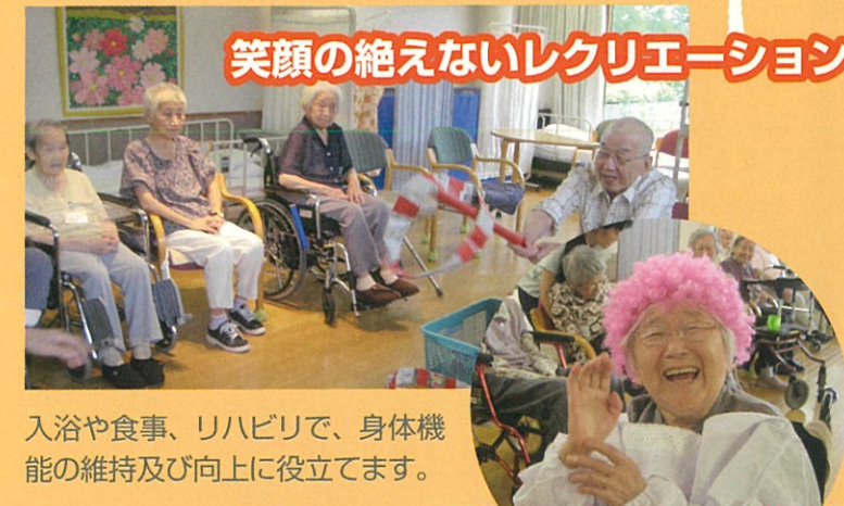
笑顔の絶えないレクリエーション