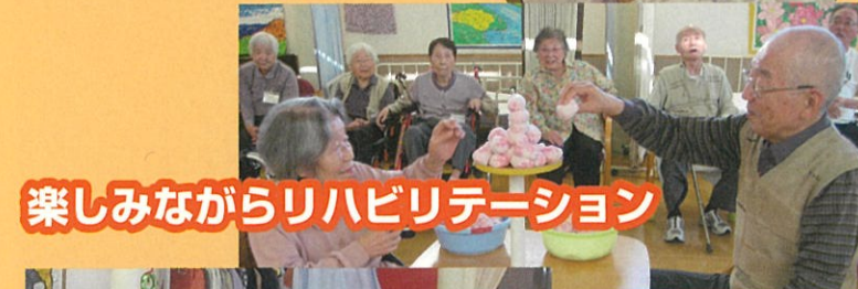
楽しみながらリハビリテーション